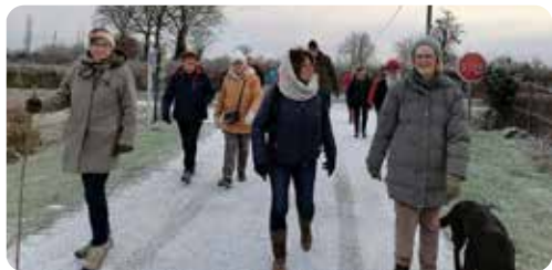
◀ Marche de la Paix du 4 janvier 2026